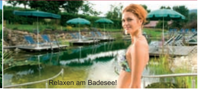
Relaxen am Badesee!