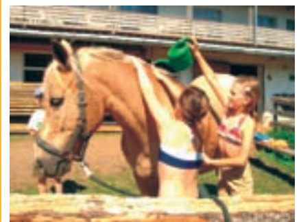
Ein Schnuppertag auf dem Reiterhof...