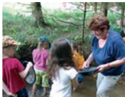
mit den Pferden zum Goldwaschen Wir reiten und wandern zum Goldwaschtal ...