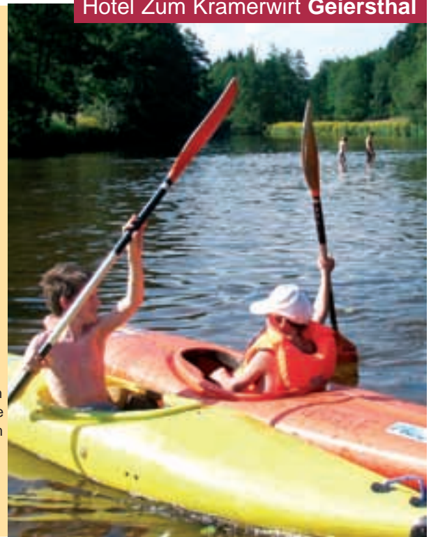
Hotel Zum Kramerwirt Geiersthal

Ufern, einsamen Lichtungen, dichtbewachsenen Waldgebieten und malerischen Dörfern.